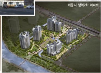
세종시 행복2차 아파트

“편안한 공간·편안한 세상” 계성종합건설이 새로운 시각으로 랜드마크를 건설합니다 월드컵 이지움아파트