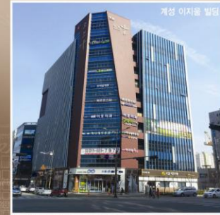
계성 이지움 빌딩